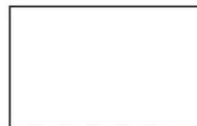
Huella legible del solicitante (La que aparece en el documento de identidad)

FIRMA _____ NOMBRE _____ No. Identificación _____ de _____ Celular _____ Correo electrónico _____